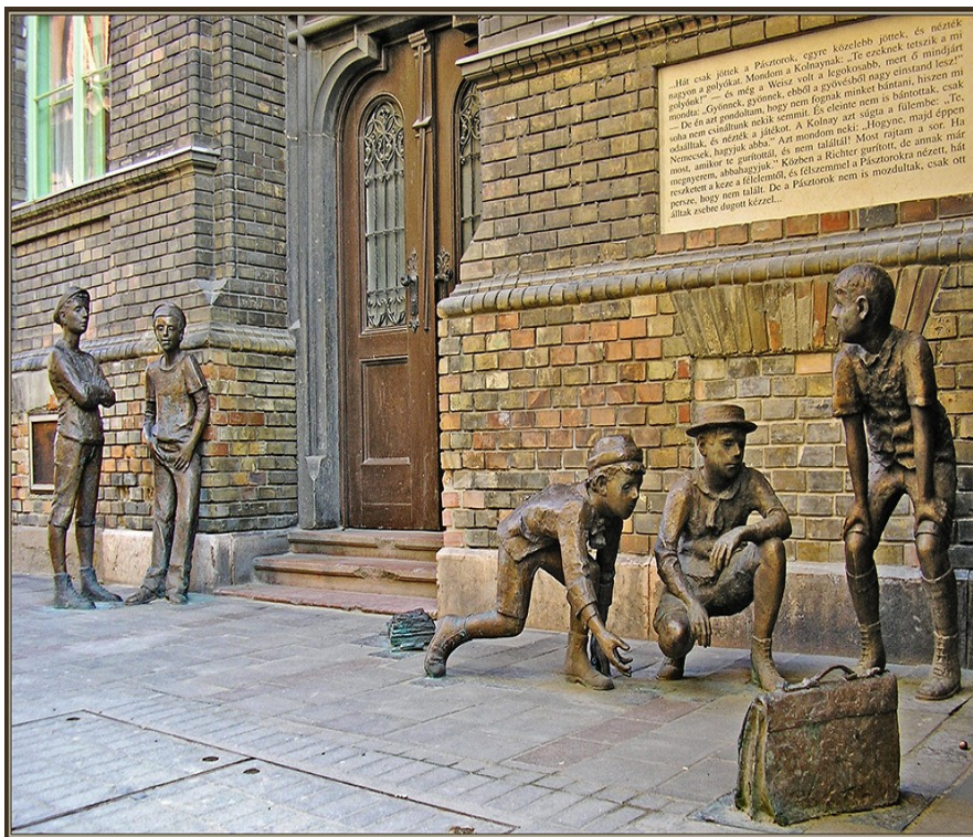
Szanyi Tibor: A Pál utcai fiúk